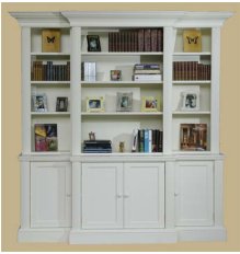
bookcase or shelves