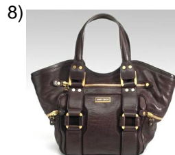
the bag, purse